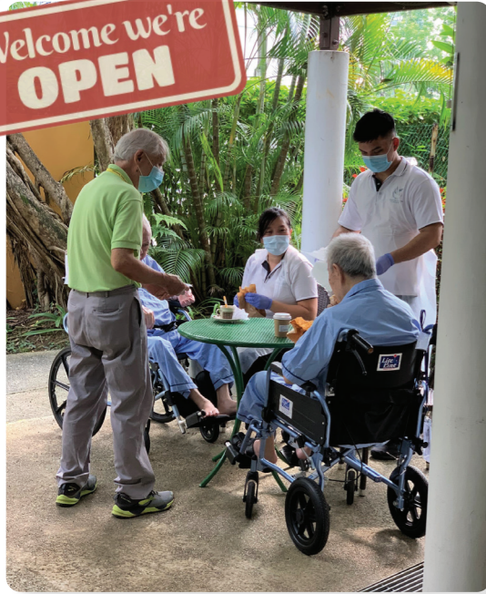
Lim Kopi 活动照片